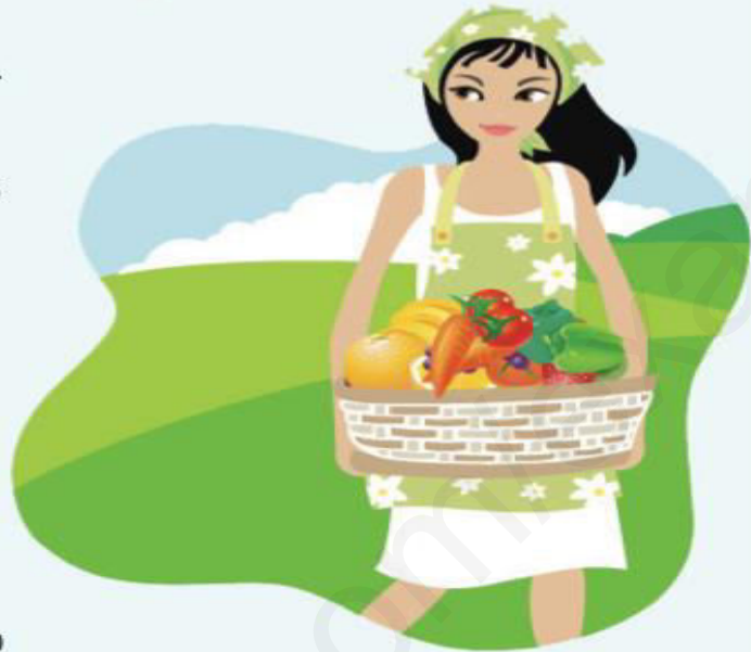
Anne Romain, Tonicmag', Février 2013

Pour rester en forme et en bonne santé, il faut manger varié et équilibré. C'est une question d'habitude ! Il est conseillé de manger de tout. Il faut consommer, chaque jour, au moins un aliment dans chacune des 5 familles d'aliments : - lait et produits laitiers, - viandes, poissons et oeufs, - fruits et légumes, - céréales et légumes secs, - matières grasses (huiles...) - sucreries (bonbons...) Mais attention aux quantités ! Certains aliments sont à consommer avec modération ! Vous devez boire tout au long de la journée au moins 1,5 litres d'eau par jour. Evitez les boissons sucrées ! Evitez de manger gras ! Il faut aussi faire du sport au moins 30 minutes par jour !