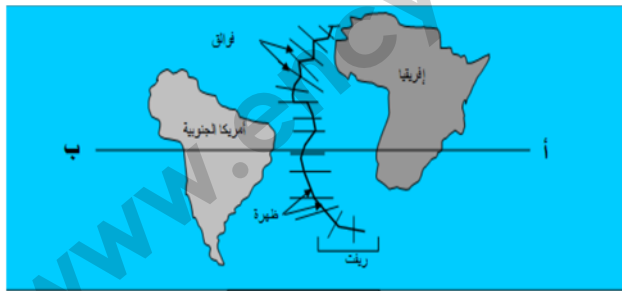
السند 2: ظهرة المحيط الأطلسي.

بهاء الدين تلميذ في السنة الثالثة متوسط، أراد ان يقتنع زميله أن القارات كانت كتلة واحدة يحيط بها بحر واحد ثم انفصلت الى عدة قارات حيث لجأ الى السندات التالية: