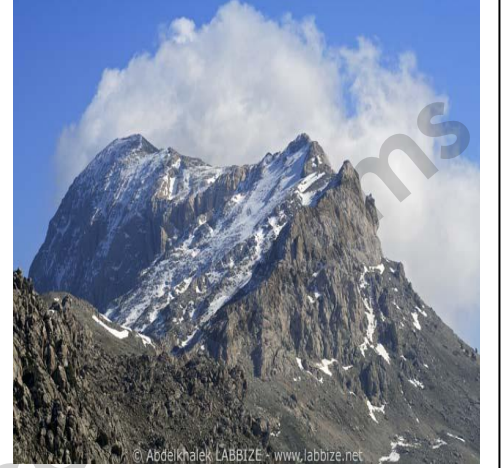
الوثيقة 1 : جبال جرجرة