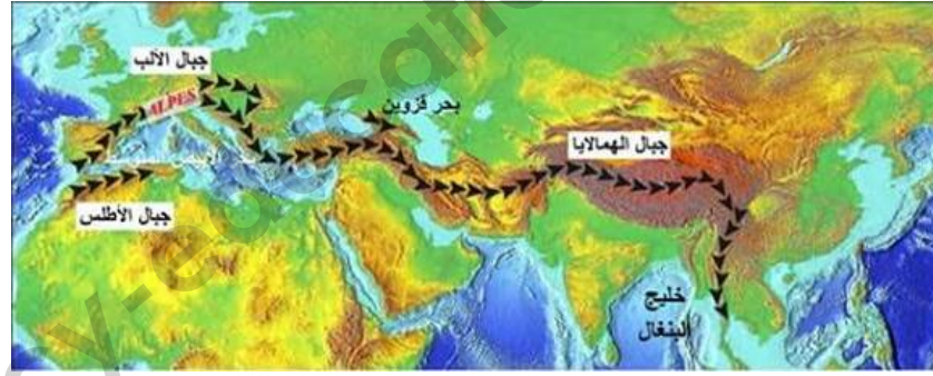
الوثيقة 4 : جزء من الحزام الزلزالي .