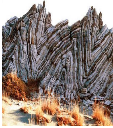
الوثيقة 2 : طيات