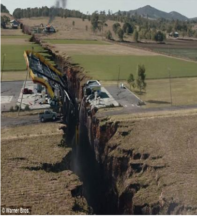
الوثيقة 3 : فالق