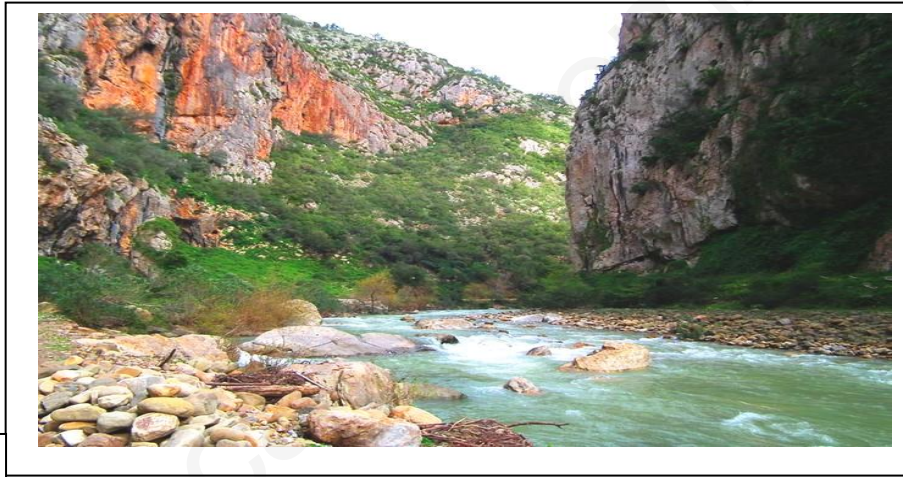
السند 3 : منظر طبيعي تلي