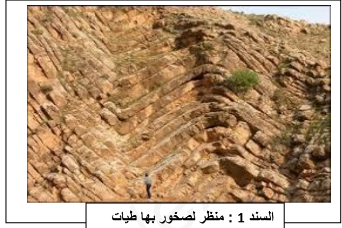
السند 1 : منظر لصخور بها طيات