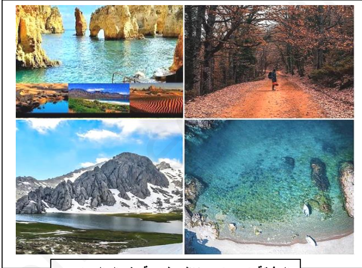
الوثيقة ( 03 ) : مناظر طبيعية بشمال الجزائر

الوضعية الثانية ( 06 نقاط ) : تتميز الجزائر بتنوع مناظرها الطبيعية على طول مساحتها واختلاف هذه المناظر في المنطقة الواحدة , كما هو في الوثيقة ( 2 , 3 )