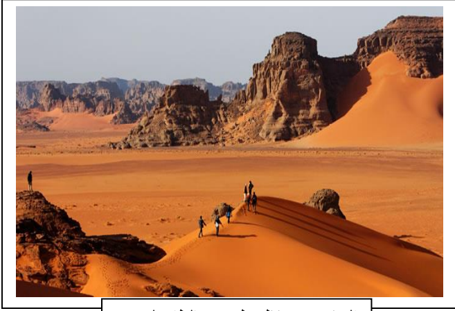
السند 2 : منظر طبيعي بالطاسيلي

لايمكن تفسير هذا التنوع إلا بمعرفة مدى تأثير الدينامية الخارجية للكرة الأرضية