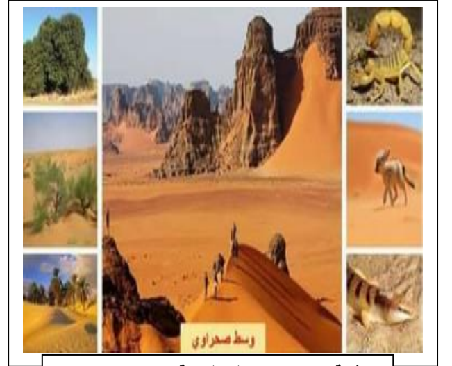
الوثيقة ( 02 ) : مناظر طبيعية بصحراء الجزائر