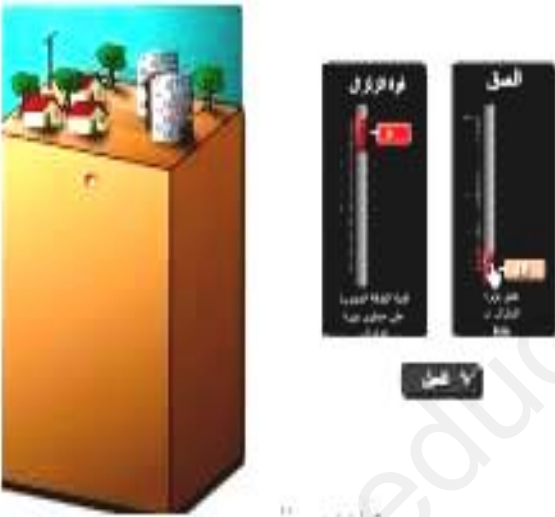
2- مخطط التركيب التجريبي المستعمل