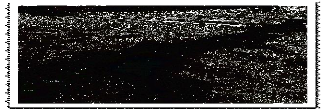
1- تشوه للقشرة الأرضية في مدينة ميله