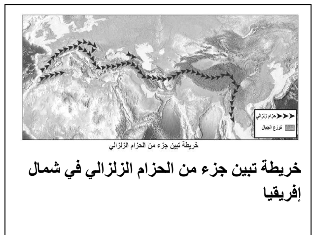
خريطة تبين جزء من الحزام الزلزالي في شمال إفريقيا