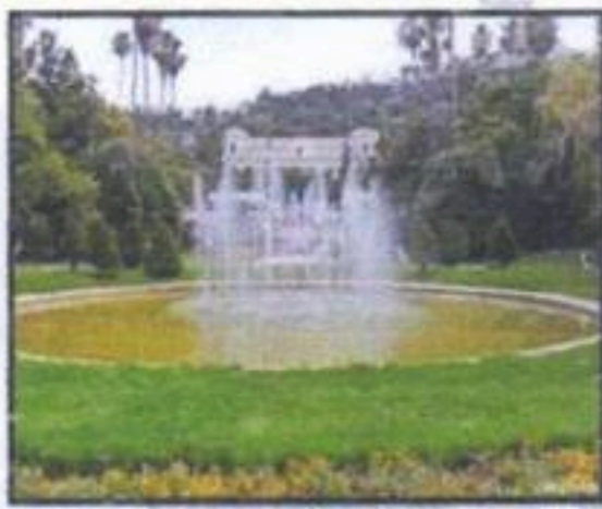
مفيد للجهاز التنفسي

أكتب تحت كل صورة العبارة المناسبة " مضر للجهاز التنفسي " أو " مفيدة للجهاز التنفسي "