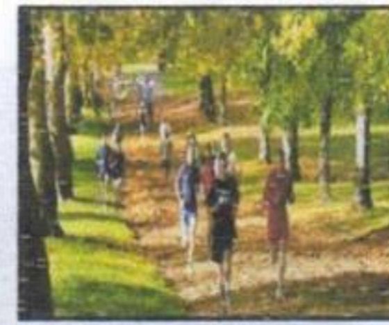
مفيد للجهاز التنفسي