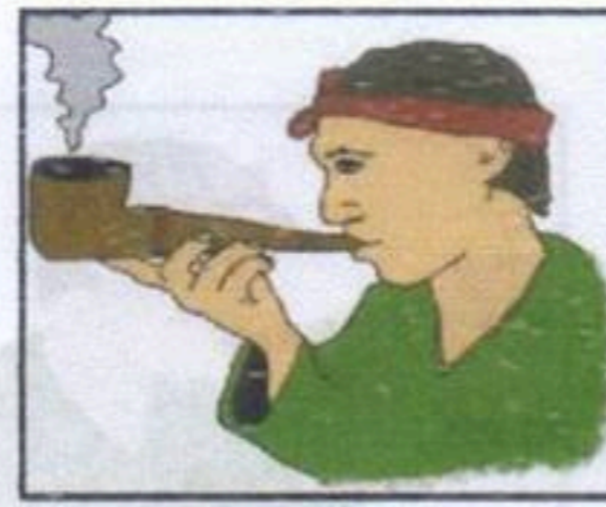
مضر للجهاز التنفسي