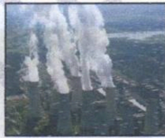
مضر للجهاز التنفسي