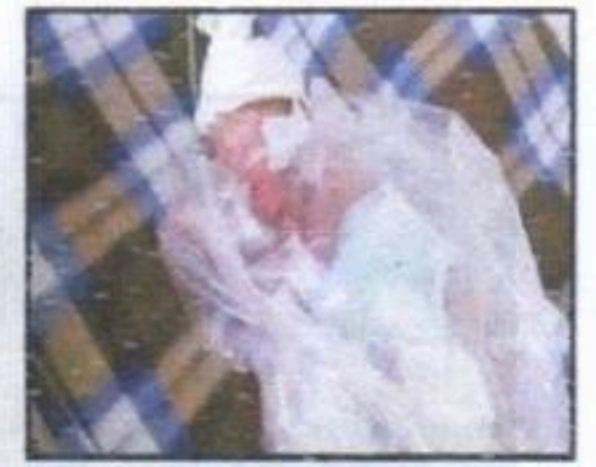
مضر للجهاز التنفسي