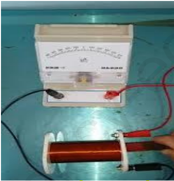
A B الوثيقة-2-