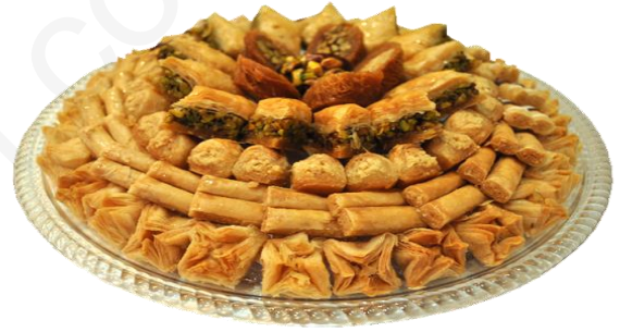
الوثيقة 03 : طبق من الحلويات الشرقية .

معتمدا على السندات المقدمة و مكتسباتك ، أجب عن التعليمات التالية :