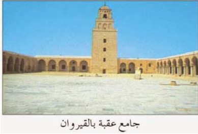
جامع عقبة بالقيروان

السند 2: أبرز بعض مظاهر تحول شمال إفريقيا إلى مغرب إسلامي :