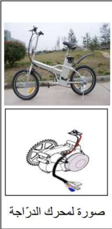
صورة لمحرك الدراجة

4) بيّن سبب اعتبار هذه الدراجة صديقة للبيئة .