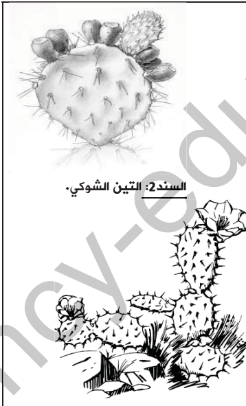
السند: التين الشوكي.

أثناء مرورك مع صديقك في منطقة قاحلة لاحظ صديقك وجود بعض النباتات الاستبسية فأثار تساؤلك قدرة هذه النباتات العيش في هذه الأوساط الحارة والفقيرة من الماء، فحاول صديقك اقتلاع نبات الشيح فلم يستطع اقتلاعها من جذورها مع أنه نبات قصير.