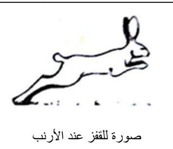
صورة للقفز عند الأرنب