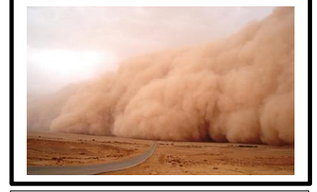
1/ عاصفة رملية تنقل الرمال المفككة

1- اذكر المركبات الاساسية للمناظر الطبيعية .