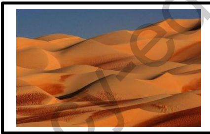
الوثيقة -3- كتبان رملية

يسود الصحراء الجزائرية المناخ الصحراوي الذي يتميز بندرة الامطار , و اختلاف درجة الحرارة بين الليل و النهار و الزوابع الرملية .