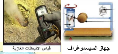
قياس الانبعاثات الغازية

وضعية إدماج : - تعتبر الزلازل والبراكين من أهم الظواهر الجيولوجية المتجدية على سطح الأرض والأكثر خطرا على حياة الإنسان بحيث لها علاقة بالنشاط الداخلي للكرة الأرضية.