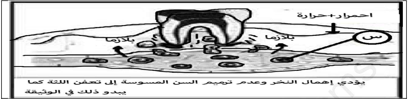
الوثيقة 1: حالة ضرس أخ سناء

الوضعية الأولى: (10ن) لسناء أخ صغير لا يحرص على نظافة أسنانه ولا ينتبه لغذائه، وذات يوم جاء يشتهي من ألم في ضرسه وانبعث رائحة كريهة من فمه وانتفاخ في الخد الموافق للضرس المصابة مع ارتفاع في درجة حرارته.