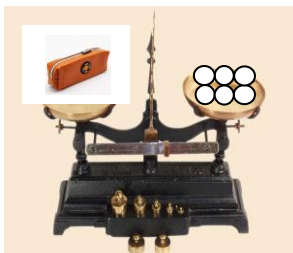
المقلمة تزن ..... كُرَيّات