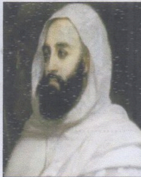
الأمير عبد القادر