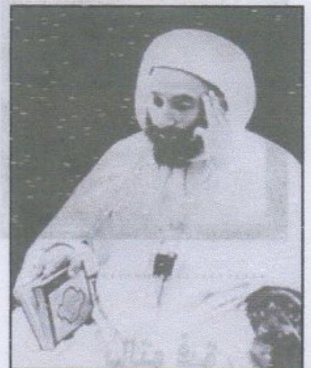
عبد الحميد بن باديس