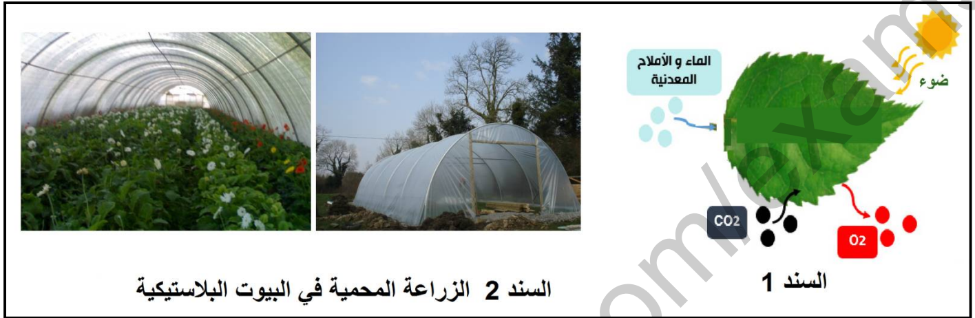
السند 2 الزراعة المحمية في البيوت البلاستيكية