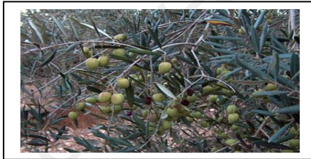
السند 3 : شجرة الزيتون