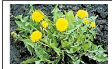
السند 2 : نبات الهندباء