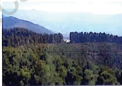
شكل المنظر الطبيعي بعد نمو الأشجار