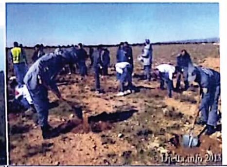
عملية غرس الأشجار في المناطق الجرداء المعرضة لتأثير العوامل المناخية