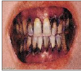
الوثيقة 2: أسنان شخص مدمن