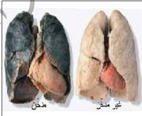
الوثيقة 3: رئة سليمة و رئة مصابة

بينما كنت تشاهد التلفاز مع أختك الصغرى شاهدتم حصة أضرار التدخين على صحة الإنسان، حيث يمثل يوم 31 ماي اليوم العالمي بدون تدخين. التدخين يؤثر سلبا على صحة الإنسان حيث يؤدي إلى هزال الجسم و اصفرار الأسنان و الروائح الكريهة.